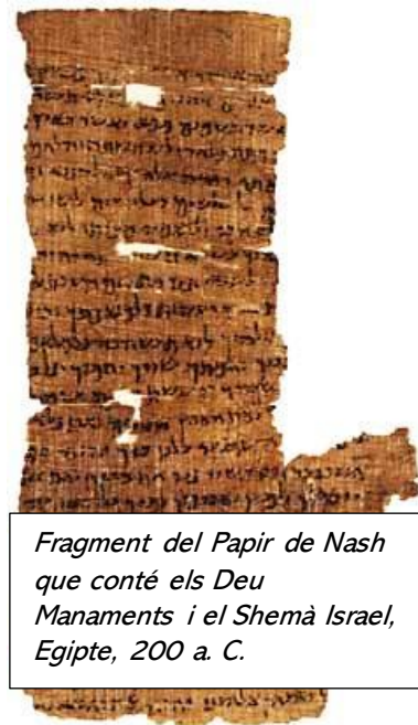
Fragment del Papir de Nash que conté els Deu Manaments i el Shemà Israel, Egipte, 200 a. C.