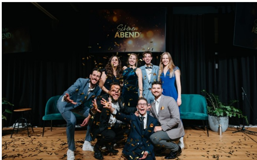
El equipo de la película en el estreno.

"La perspectiva en primera persona em va commoure profundament i em va fer reflexionar; realment sents que estàs vivint aquestes experiències tu mateix", va comentar un dels assistents a l'estrena.